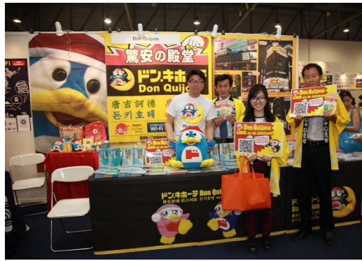
◆ブースイメージB（2ブースの場合）